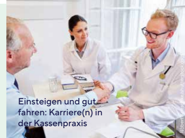
Einsteigen und gut fahren: Karriere(n) in der Kassenpraxis

tolle Möglichkeiten, Praxisluft zu schnuppern. Und das bereits während der Ausbildung! Nutzen Sie die Angebote des Projekts "Allgemeinmedizin - die erste Wahl" und gewinnen Sie authentische Eindrücke vom Beruf der Allgemeinmedizinerin bzw. des Allgemeinmediziners, bevor Sie über Ihren persönlichen Karriereweg entscheiden. Details erfahren Sie beim Institut für Allgemeinmedizin und evidenzbasierte Versorgungsforschung.