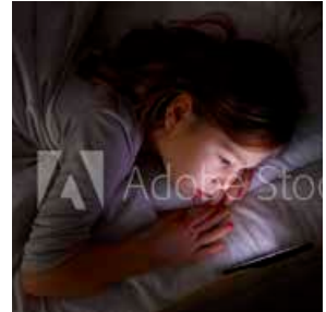
Ein heller Bildschirm abends lässt uns nicht müde werden!

Zu Regel 10: Hier idealerweise die beiden Wochentage, an denen keine strukturierte Freizeitbeschäftigung stattfindet, eintragen!