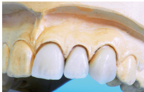
Brücke im Oberkiefer

Kleinere Zahnlücken können durch eine Brücke geschlossen werden. Eine Brücke besteht aus (Pfeiler) Kronen und einem oder mehreren Zwischengliedern. Brücken werden wahlweise aus Vollkeramik, Verblendkeramik oder Zirkonoxid, das sich durch seine natürliche Ästhetik und hohe Festigkeit auszeichnet, angeboten.