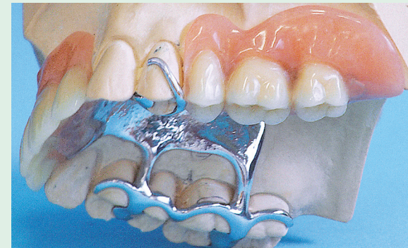
Metallgerüstprothese mit Klammern

Wichtig: Bitte lassen Sie die Prothese im Mund, damit etwaige Druckstellen festgestellt werden können!